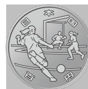
原寸 (直径 22.6 mm)