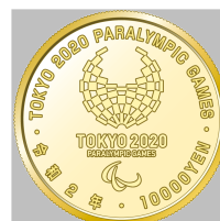
原寸 (直径 26 mm)