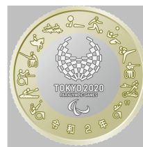
原寸 (直径 26.5 mm)

○ 東京2020パラリンピック競技大会エンブレムの周囲に、バドミントン、カーヌー、卓球、車いすフェンシング、馬術、ボート、パワーリフティング、5人制サッカー、シッティングバレーボール、テコンドー、射撃、トライアスロン、車いすバスケットボールに関する東京2020パラリンピックスポーツピクトグラムを配しています。