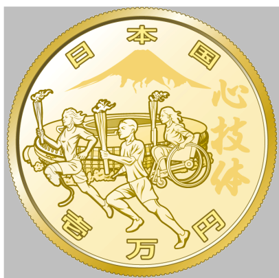
原寸 2 倍