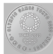
原寸 (直径 22.6 mm)