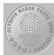
原寸 (直径 22.6 mm)