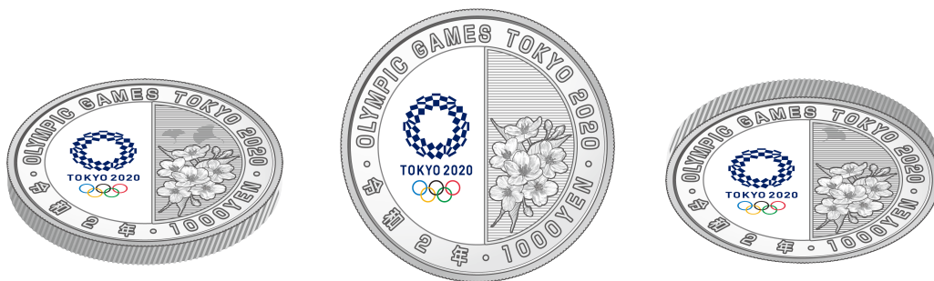
裏面（上方方向に傾けたもの）