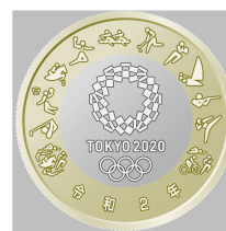
原寸 (直径 26.5 mm)

○ 東京2020オリンピック競技大会エンブレムの周囲に、近代五種、ゴルフ、バスケットボール、馬術、ハンドボール、ボート、ホッケー、ラグビー、セーリング、射撃、テコンドー、トライアスロンに関する東京2020オリンピックスポーツピクトグラムを配しています。