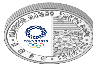
裏面（下方向に傾けたもの）